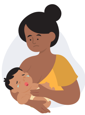
Dificuldade de alimentação