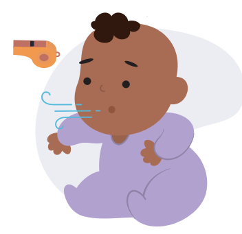
Chiado no peito

O vírus sincicial respiratório é um vírus sazonal altamente contagioso que pode levar a internações para alguns bebês e crianças.